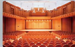
第一生命ホール (晴海トリトンスクエア内)

10代で巨匠ロストロポーヴィッチに 『世界で最も優れた若手ヴァイオリニスト』と絶賛され、 国際的に活躍する木嶋真優がお届けする、 ヴァイオリンの名曲の数々