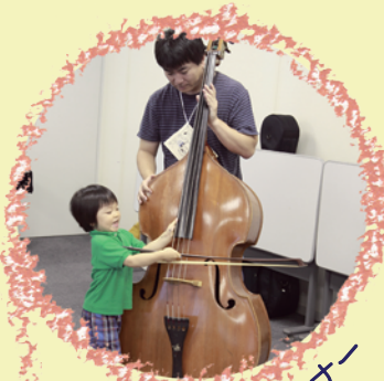
弦楽器体験コーナー