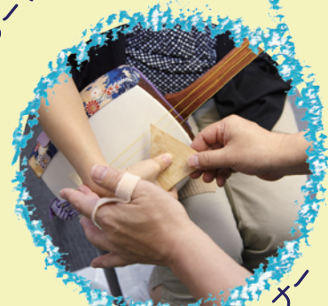
三味線体験コーナー