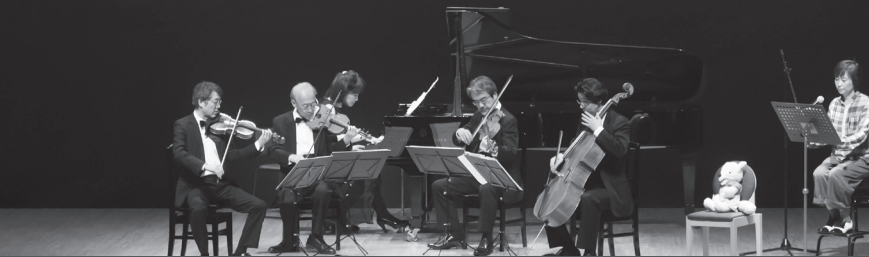
過去の様子