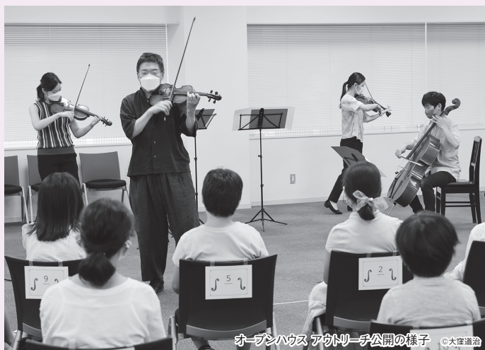
オープンハウス アウトリーチ公開の様子 ©大塚道治