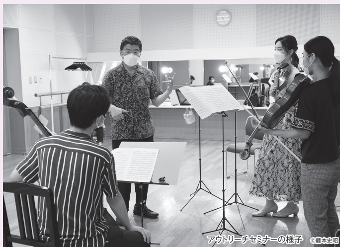
アウトリーチセミナーの様子