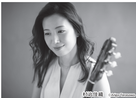
村治佳織

映画音楽など、聴き手のみなさまそれぞれの思い出と結びつくような馴染み深い名曲と、楽器本来の魅力を全開で楽しめるギターのためのオリジナル曲がバランスよく組み立てられ、聴いているうちに心も身体もほぐれていく贅沢な時間を過ごしていただけること間違いな