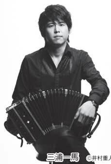
三浦一馬

凄腕そろいのTGSが拠点とする第一生命ホールで、今年も迫力のサウンドをお楽しみください。