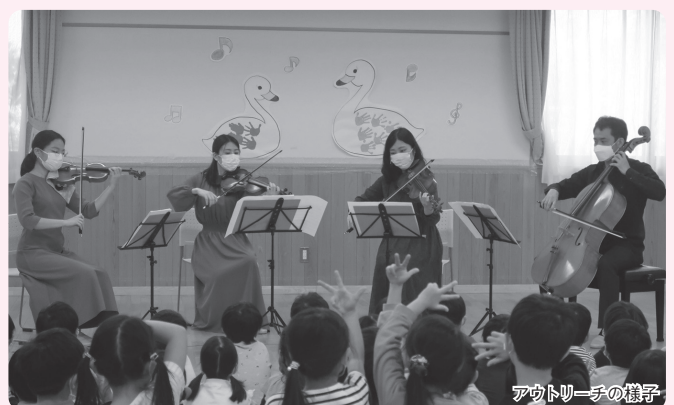
アウトリーチの様子

※アウトリーチ:トリトンアーツが取り組むコミュニティ活動。第一生命ホール近隣の幼稚園・保育園・小学校・病院・福祉施設などに音楽をお届けしています。