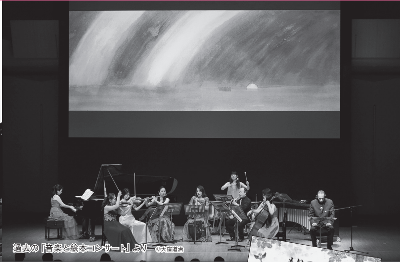
過去の「音楽と絵本コンサート」より