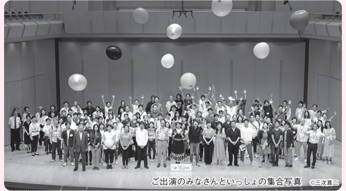
ご出演のみなさんといっしょの集合写真

ご興味がある方は、お気軽にお問い合わせください(現在はzoomなどでご説明とご登録面談を行っております)。詳しくは、QRコードから、またはホームページの「サポーターについて」をご覧ください。