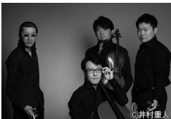
YAMATO String Quartet