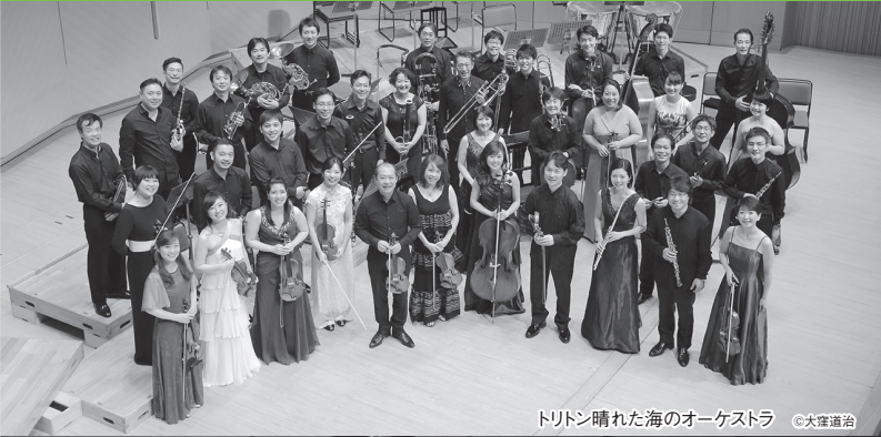
トリトン晴れた海のオーケストラ