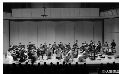
トリトン晴れた海のオーケストラ