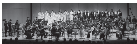
演奏会の様子

さる2021年11月27日に第一生命ホールで開催された“トリトン晴れた海のオーケストラ”による「第九」公演。満席の客席からは大きな拍手が鳴り響き、大好評の内に幕を閉じました。その演奏を、繰り返し、ご自宅でもお楽しみ頂けます。