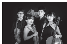
クアルテット・インテグラ