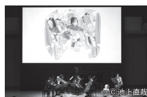
過去の様子 音楽と絵本「こんとあき」