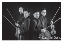
ウェールズ弦楽四重奏団