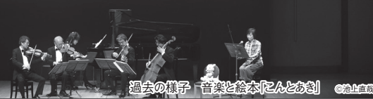
過去の様子「音楽と絵本『春とあき』」