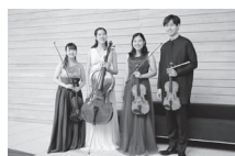
チェルカトーレ弦楽四重奏団