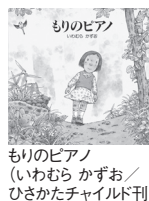
もりのピアノ いむむら かずお/ ひさかたチャイルド刊]