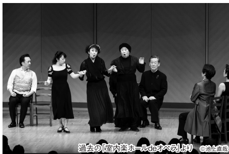
過去の「室内楽ホールdeオペラ」より

「このアイディアは、音響が優れている第一生命ホールでの公演だということで考えました。第一人者の妻屋さんと、若手の素晴らしいお二人が出演します。贅沢ですよ（笑）。迫力にご期待ください。ドン・ジョヴァンニに殺されてしまう騎士長は神のような絶対的な存在としてよみがえりますが、ドン・ジョヴァンニの行動を姿を変えながら常に見ているんです。それはドン・ジョヴァンニ自身に自分が犯してしまったことへの意識があるからなんです」