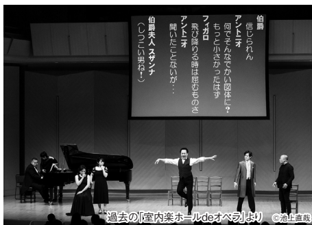
過去の「室内楽ホールdeオペラ」より

なさんモーツァルトのオペラですでに様々な役を歌っているの、その経験が活かされる舞台になると思います。私が書いた台本が、リハーサルでどう変化するかも楽しみです」