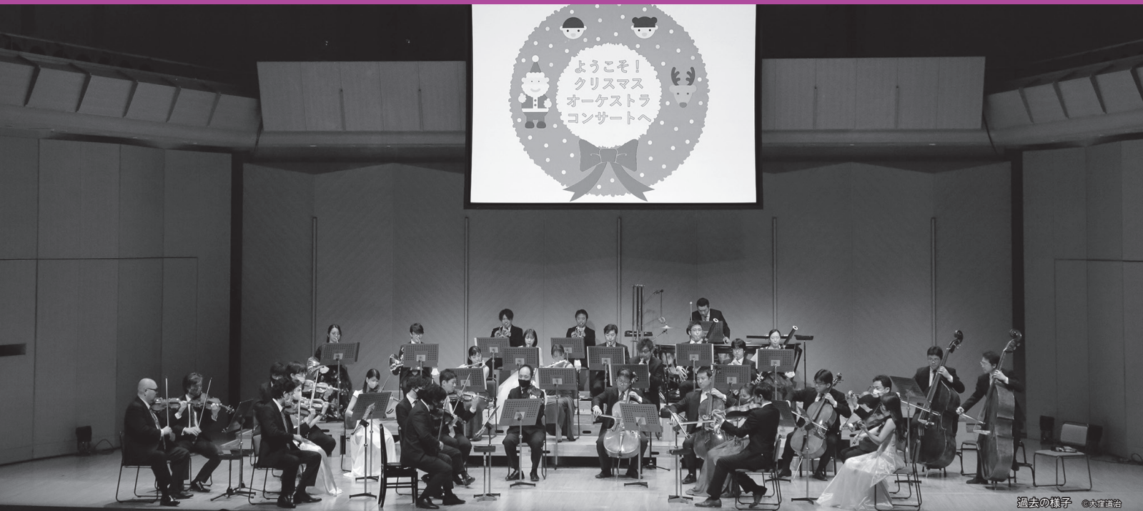
過去の様子