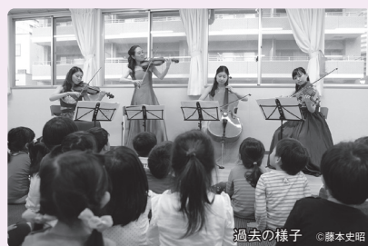
過去の様子

ほとんどの場合は、1回のアウトリーチで目に見える変化はなかなかないかもしれませんが、でもそれでいいのです。小さな芽がつぼみとなっていつのまにか花開くように心を豊かにしてくれたら…そして、その後もずっとその子の中で音楽が人生における大切なお友だちとなって、悲しい時うれしい時に寄り添ってくれる存在となってきていたら…私たちにとっても、これほどうれしいことはありません!