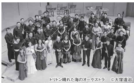
トリトン晴れた海のオーケストラ ©大窪道治