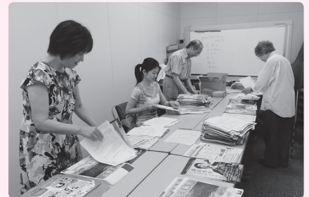
コンサートチラシ発送作業