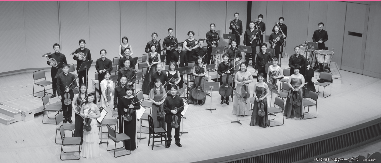
トリトン晴れた海のオーケストラ ©大塚道治

NPO TRITON ARTS NETWORK 認定NPO法人 トリトンアーツネットワーク