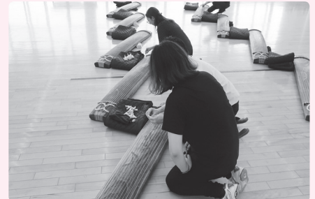
学校で楽器体験の準備