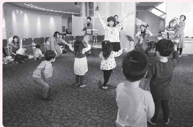
過去の様子

0歳6ヶ月～3歳までのお子さまと、親子でいっしょに楽しめる「ロビーでよちよちコンサート」。第一生命ホールのロビーで輪になって、ヴァイオリンやトランペットなど5人の演奏家の楽器を、間近に見て、クラシックの名曲を聴いて、時には音楽といっしょに楽器を鳴らして楽しめる45分間のコンサートです。