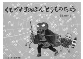
「くものすおやぶんとりものちょう」 秋山あゆ子作 福音館書店