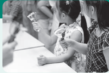
過去の様子/ミュージックベル

4月号から毎月お知らせしてきた「第一生命ホールオープンハウス」が7月18日に迫ってきました。今回は、当日のタイムスケジュールと各コーナーの内容をお知らせします。コンサートホールで過ごす夏の1日をどうぞお楽しみください。