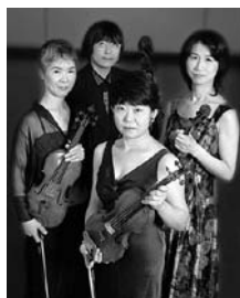
古典四重奏団

レクチャーは、田崎さんのトークと、古典四重奏団による実演つき。「特にヤナーチェクは、特異な部分を取り出して、おもしろさを解説したいと思います」。