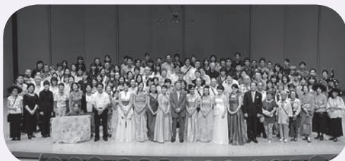
昨年の様子(出演者とサポーターのみなさん)

このオープンハウスで、当日の準備、受付、ご案内などをお手伝いして下さるサポーター(ボランティア・スタッフ)を募集しています。