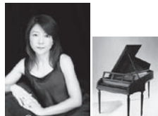
仲道郁代 フォルテピアノ

フランスの歌「ああ、お母さん聞いて」による 12の変奏曲 八長調 K265 (さらさら星変奏曲) ピアノ・ソナタ第11番 イ長調 トルコ行進曲 K331 ロンド イ短調 K511 ピアノ・ソナタ第8番 イ短調 K310 ロンド 二長調 K485 幻想曲 二短調 K397 ピアノ・ソナタ第3番 変ロ長調 K281