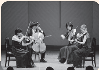
古典四重奏団