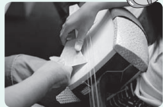
昨年の様子（三味線体験）