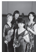
古典四重奏団

○オール・モーツァルト・プログラム 弦楽四重奏曲 ハ長調K157「ミラノ四重奏曲」 (第4番)/ハ長調K170「ヴェーン四重奏曲」(第 10番)/変ロ長調K589「プロイセン王四重奏曲 第2番」(第22番)/変ホ長調K428「ハイドン四 重奏曲第4番(第3番)」(第16番) ■一般¥3,500 シニア¥2,500 ヤング¥1,500 助成:公益財団法人 花王 芸術・科学財団