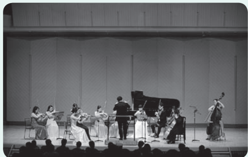
昨年の様子（ホールステージ）

「音楽のまほう」にかかるワクワクはいろいろありますが、一番のお勧めはなんといってもホールのステージプログラム！ ピアノと弦楽器の魅力を存分に楽しめるほか、アーティストの素顔にも触れることができます。今年は、「0歳からのガラ・コンサート」も登場！ ご家族といっしょに、クラシックの名曲を楽しんでください。ホールの上質な響きの中で「音楽のまほう」にかかってしまうかも……。