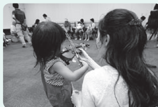
昨年の様子（弦楽器体験）