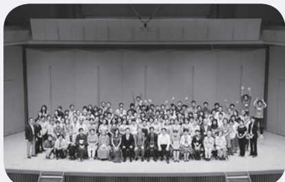
昨年の様子(出演者とサポーターのみなさん)

このオープンハウスではいろいろなコーナーでサポーターが大活躍します。みなさんもサポーターとしてオープンハウスを体験してみませんか?