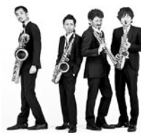
ブルーオーロラ サクソフォン・カルテット

J.S.バッハ(平野公崇編): 平均律クラヴィーア曲集第2巻より第1番プレリュード&フーガ ハ長調 チャイコフスキー(平野公崇編): 「四季」op.37 bisより「1月 炉端にて」「4月 松雪草」 グラズノフ: サクソフォン四重奏曲 変ロ長調 op.109より第3楽章 J.S.バッハ(平野公崇編): 主よ、人の望みの喜びよ バルトーク(平野公崇編): ミクロコスモス第6巻「ブルガリアのリズムによる6つの舞曲」から 平野公崇: ララバイ (「江戸の子守唄」による) ■一般¥1,500 2公演(第13・14回)セット券¥2,500 *第14回 7月2日(火)田村響ピアノ・リサイタル ※託児サービスあり(0歳~未就学児/公演5日前までの申込制/お子さま1名につき¥2,000) 協賛: アフラック(アメリカンファミリー生命保険会社)