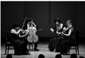
古典四重奏団

3月17日(日)14:00 古典四重奏団~チャイコフスキー氏からの手紙~ オール・チャイコフスキー・プログラム 弦楽四重奏曲第1番 二長調op.11「アンダンテ・カンタービレ」 弦楽四重奏曲第2番 へ長調op.22 弦楽四重奏曲第3番 変ホ短調op.30「葬送のアンダンテ」 ■一般¥3,500 シニア¥2,500 ヤング¥1,500 助成:公益財団法人 花王 芸術・科学財団／公益財団法人日本室内楽振興財団