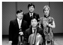
エルデーディ弦楽四重奏団

オール・ブリテン・プログラム 弦楽四重奏曲第1番 二長調op.25 弦楽四重奏曲第3番op.94 弦楽四重奏曲第2番 ハ長調op.36 ■一般¥3,500 シニア¥2,500 ヤング¥1,500 助成:公益財団法人 花王 芸術・科学財団／ 公益財団法人日本室内楽振興財団 認定:公益社団法人 企業メセナ協議会