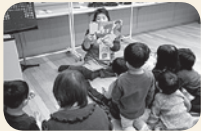
過去の様子

TANかわら版12月号でもご紹介した「育児支援コンサート～子どもを連れてクラシックコンサート～」。まだまだお手伝いいただきサポーター(ボランティアスタッフ)を大募集中です。子どもが好き、音楽が好き、ボランティアに興味がある方など、ぜひお気軽にご連絡ください。