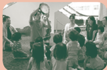
過去の様子