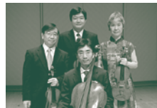
エルデーディ弦楽四重奏団