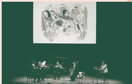
過去の公演の様子

そうですね。でも木琴より低音まで出せますし、鍵盤の下に共鳴用のパイプがついています