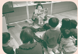
昨年の様子

育児支援コンサートでは、保護者の方にホールで音楽を楽しんでいただくあいだ、子どもたち(4~6歳対象)には子どもスタジオで音楽体験をしてもらいます。そこで大活躍していただくのが、サポーターのみなさん。子どもたちといっしょになって音楽体験のお手伝いをしていただいたり、お客さまをご案内いただいたり…。さあ、私たちといっしょにコンサートを作ってみませんか?