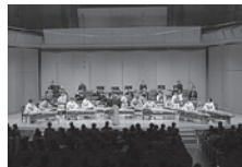
昨年の様子

長澤勝俊:尺八協奏曲(1978) 秋岸寛久:十七絃と邦楽器群のための協奏曲(2008) 肥後一郎:四拍子協奏(1999) 高橋久美子:尺八・箏のための協奏曲 「響もせば…」(委嘱初演作品/2012)