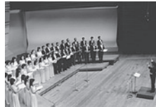
「さくら」を東京混声合唱団に混ざって一緒に歌う武満徹さん

混声合唱のための「うた」(1979-1992) 混声合唱のための「風の馬」 (1961/1966東京混声合唱団委嘱作品) 男声合唱のための「芝生」(1982) 男声六重唱のための「手づくり謠」-四つのポップ ・ソング(1987) MI・YO・TA(2002/沼尻竜典 編曲)