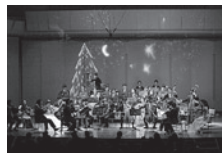
昨年の様子

早川正昭:バロック風「日本の四季」より「冬」(弦楽合奏) ハイドン:ディヴェルティメントより(木管五重奏) アンダーソン:トランペット吹きの休日/ クリスマス・フェスティバル メンデルスゾーン:交響曲第4番 イ長調 「イタリア」より第1楽章 グルーバー:きよしこの夜～みんなで歌いましょう～