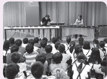
真剣なまなざしでマリンバの演奏に耳を傾ける子どもたち

*時間未定。詳細は決定次第ホームページに掲載いたします。また、次号のTANかわら版でもお知らせいたします。