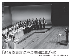
「さくら」東京混声合唱団に混ざって一緒に歌う武満徹さん

武満徹: 混声合唱のための「うた」(1979-1992) 小さな空(武満徹 詞) / うたうだけ(谷川俊太 郎 詞) / 小さな部屋で(川路明 詞) / 恋の かくれんぼ(谷川俊太郎 詞) / 見えないこ ども(谷川俊太郎 詞) / 明日ハ晴レカナ、曇リカ ナ(武満徹 詞) / さくら(日本古謡) / 翼(武満 徹 詞) / 島へ(井沢満 詞) / ○(マル)と△ (三角)の歌(武満徹 詞) / さようなら(秋山邦 晴 詞) / 死んだ男の残したものは(谷川俊太 郎 詞) 混声合唱のための「風の馬」(1961/1966東京混 声合唱団委嘱作品)(秋山邦晴 詞) 第1ヴォカリーズ / 指の呪文 / 第2ヴォカリー ズ / 第3ヴォカリーズ / 食卓の伝説 男声合唱のための「芝生」(1982)(谷川俊太郎 詞 / W.S.マーヴィン 訳) 男声六重唱のための「手づくり謠」—四つのポップ ・ソング(1987)(瀧口修造 詞 / ケニス・ライオ ンズ 英訳) MI・YO・TA(2002)(沼尻竜典 編曲 / 谷川俊太郎 詞) ■S席¥5,000 A席¥4,000 (A席は残席僅少、B席は完売いたしました)