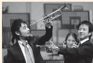
昨年の管楽器紹介の様子

オーケストラには、まだまだ楽器が必要です。太鼓や鈴、タンバリンなど叩いたり振ったりして、リズムをきざんだり様々な音で音楽を盛り上げる、打楽器の紹介コーナーもお楽しみに。