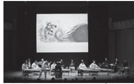
過去の様子 ©大窪道治