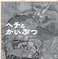
文:ジョン・ハンソブ 絵:ハンビョンホ 訳:おおたけきよみ 出版:アートン新社

物語の主人公は、昔から韓国に伝わる想像上の動物ヘチ。天に住み、正義を守る太陽の神です。ある時、暗い地の底に住むおそろしい怪物4兄弟ムンチギ大王、ブンギ大王、トンチギ大王、バクチギ大王が、ヘチの寝ている間に太陽をぬすみだしてしまいます。さあ世界はどうなってしまおうのでしょうか…?