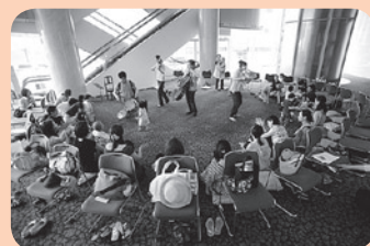
過去の様子