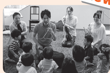
過去の様子