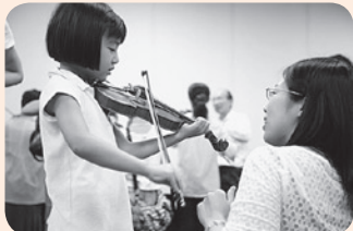
昨年の様子(弦楽器体験)

今回のステージの主演はチェロ弾き。彼のお部屋にいろんな楽器を持った演奏家が集まってきます。さあ、仲間たちとの共演を聴いてみましょう。ふだんは見ることのできない音楽会の裏側も、ちょっとだけお見せします。またガラ・コンサートには1分間指揮者コーナーも新たに登場します。