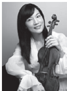
千住真理子