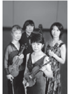
古典四重奏団 ©藤本史昭

チャイコフスキー:弦楽四重奏曲第1番 二長調op.11／弦楽四重奏曲第2番 へ長調op.22／弦楽四重奏曲第3番 変ホ短調op.30