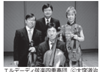
エルデーティ弦楽四重奏団

~ブリテン、生誕100年を記念して~ ブリテン:弦楽四重奏曲第2番 八長調op.36 他