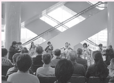
第一生命ホールロビーコンサートの様子

TANはこれからプロとして活躍する若い演奏家を支援するため、室内楽アウトリーチセミナーを継続します。