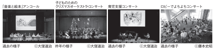
過去の様子 ©大塚道治 過去の様子 ©大塚道治 過去の様子 ©大塚道治 過去の様子 ©藤本史昭

2012年7月/12月/2013年3月(予定) 1~3歳のお子さまとその保護者の方向けの、ロビーで行う45分間の小さなコンサート