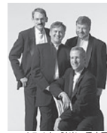
オライオン弦楽四重奏団

シューマン:ピアノ五重奏曲 変ホ長調 op.44 シューベルト:弦楽四重奏曲第14番 二短調D.810「死と乙女」 他