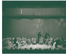
昨年のステージより

モーツァルト:ディヴェルティメント 二長調K.136 パッヘルベル:カノン 二長調 J.S.バッハ:主よ、人の望みの喜びよ グルーバー:きよしの夜 ブリテン:シンプル・シンフォニーop.4 フランセ:弦楽三重奏曲 ドヴォルザーク:弦楽セレナード ホ長調op.22 一般¥3,000 シニア¥2,000 ヤング¥1,000