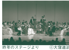
昨年のステージより

モーツァルト:ディヴェルティメント 二長調K.136 パッヘルベル:カノン 二長調 J.S.バッハ:主よ、人の望みの喜びよ グルーバー:きよしの夜 ブリテン:シンプル・シンフォニーop.4より第2楽章・第3楽章 ドヴォルザーク:弦楽セレナード ホ長調op.22より第5楽章 大人¥1,000(中学生以上) 子ども¥500(4歳以上) ※4歳以上入場可能(公演当日の年齢)、チケットはお1人様1枚必要となります。 ※託児サービスはございません。