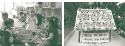
リバーシティ イングリッシュスクール

11月16日(火) 月島児童館弦楽器ワークショップ かんたん？むずかしい？弾いてみた～い！弦楽器