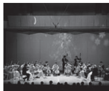
昨年のステージより

モーツァルト:ディヴェルティメント 二長調K.136 パッヘルベル:カノン 二長調 J.S.バッハ:主よ、人の望みの喜びよ グルーバー:きよしこの夜 ブリテン:シンプル・シンフォニーop.4 フランセ:弦楽三重奏曲 ドヴォルザーク:弦楽セレナード へ長調op.22 一般¥3,000 シニア¥2,000 ヤング¥1,000