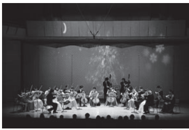
昨年のステージより

若い音楽家が真の音楽家として社会に羽ばたいてゆくのを応援しようという趣旨でおこなっている弦楽合奏セミナー「アドヴェントセミナー」。セミナー最終日には、その成果を発表する場として、2つのクリスマスコンサートを開催します。