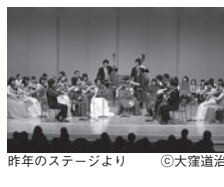
昨年のステージより

モーツァルト:ディヴェルティメント 二長調K.136 パッヘルベル:カノン 二長調 J.S.バッハ:主よ、人の望みの喜びよ グルーバー:きよしこの夜 ブリテン:シンプル・シンフォニーop.4より第2楽章・第3楽章 ドヴォルザーク:弦楽セレナード へ長調op.22より第5楽章 大人¥1,000(中学生以上) 子ども¥500(4歳以上) ※4歳以上入場可能(公演当日の年齢)、チケットはお1人様1枚必要となります。 ※託児サービスはございません。