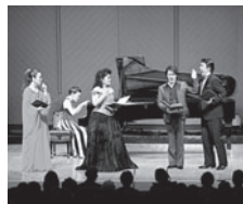
昨年のステージより

12月23日(木・祝) 10:30 子どものための クリスマスコンサート 松原勝也(ヴァイオリン) 川崎和憲(ヴィオラ) 山崎伸子(チェロ) アドヴェント弦楽合奏団