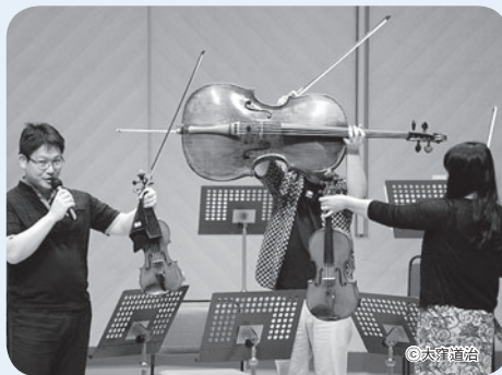
ステージでの弦楽器紹介