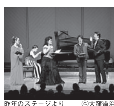
昨年のステージより

第1部 声の芸術～至福のオペラアリア モーツァルト:歌劇「フィガロの結婚」より「恋とはどんなものから」 ドニゼッティ:歌劇「ルチア」より「我が祖先の墓」 モーツァルト:歌劇「ドン・ジョヴァンニ」より「カタログの歌」 パンスタイン:歌劇「キャンディード」より「きらびやかに着飾って」 第2部 オペラ歌手が歌う麗しの名曲 ラフマニノフ:ヴォカリーズ ロイド＝ウェバー:「キャッツ」より「メモリー」 デ・クルティス:帰れソレントへ アルフレッド・ニューマン:慕情のテーマ ほか ペア¥5,000 一般¥3,000 学生(限定販売)¥1,000