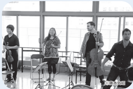
ミロ・カルテット

まず5月31日(月)の午前中は、中央区立明石小学校で、4年生のクラスを対象にアウトリーチを実施。ベートーヴェンやモーツァルトの弦楽四重奏曲が演奏されたほか、楽器や曲の構成についての楽しいお話もあり、子どもたちはみんな、ふだんなかなか接する機会のない