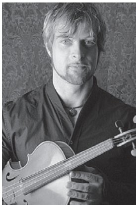
ジョン・ラジェス(ヴィオラ)

シックというより、ロックスターみたいなもの(笑)。聴衆は気楽で、ファンの方々、って感じですね。コンサートは、良い時間を過ごし、エネルギーを貰い、ステージでのアクションを観に来る、って雰囲気かな。