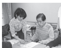
講話社シニアおこやか教室