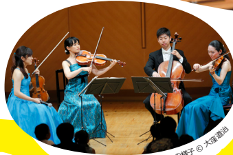
過去の様子 © 大塚聖広