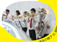
過去の様子 © 超陽有紀子

トランペット(2名)、ホルン、トロンボーン、チューバによるTANBRASSのコンサート。0才から楽しめます。