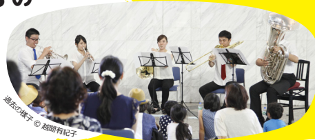
過去の様子