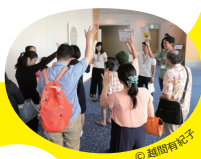
*整理券は当日配布

今日だけ特別！ふだんは入ることができないコンサートホールの舞台裏をツアーで回ろう！どなたでもご参加ください！裏方体験コーナーもあるよ！