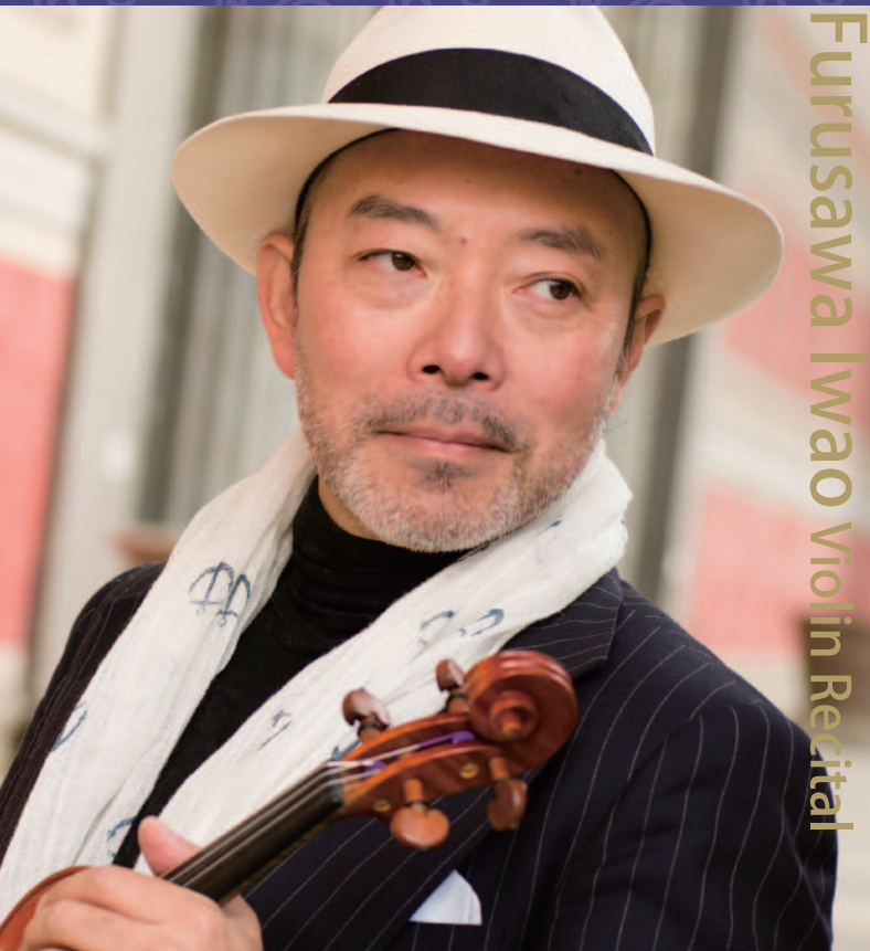
Furusawa Iwao Violin Recital