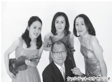
カルテット・エクセルシオ

前半は、チェルカトーレ弦楽四重奏団がブラームスの弦楽四重奏曲第1番を、カルテット・エクセルシオは「春」の愛称で知られるモーツァルトの第14番を。後半は、2団体8名で聴かせる、ブルッフ作曲の弦楽八重奏曲を華やかにおおくりします。