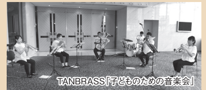
TANBRASS「子どものための音楽会」