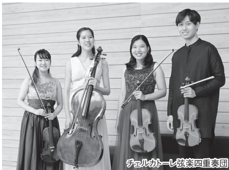
チェルカトーレ弦楽四重奏団