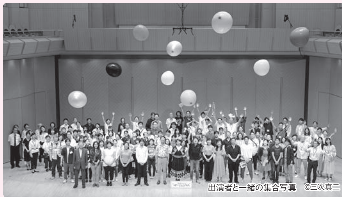
出演者と一緒に集合写真