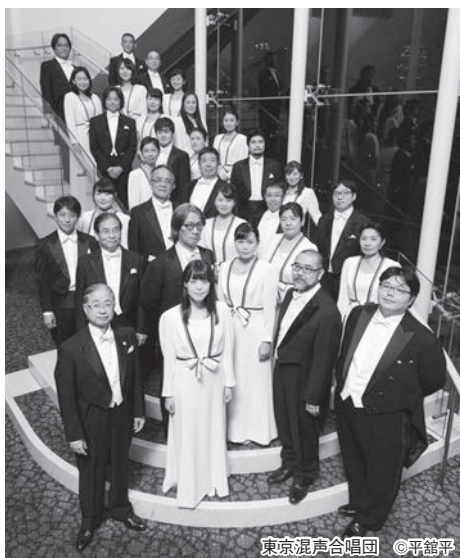
東京混声合唱団