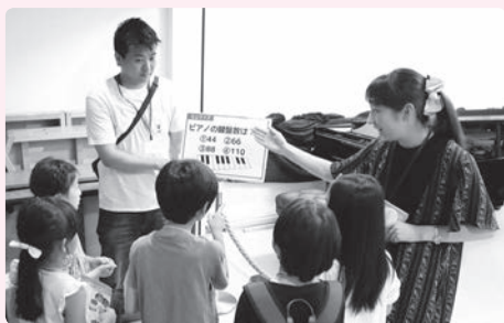
第一生命ホールオープンハウスで舞台裏をご案内中