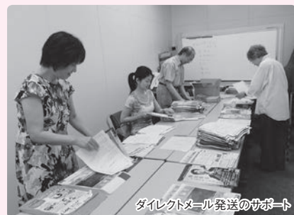
ダイレクトメール発送のサポート