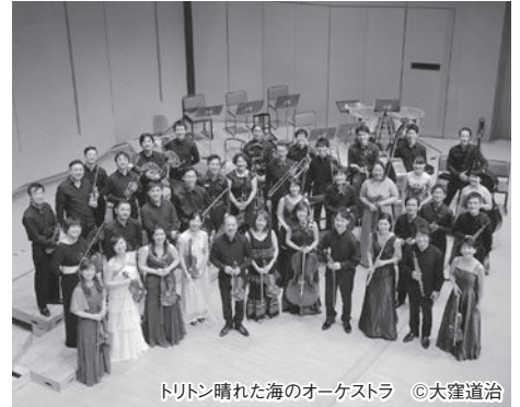
トリトン晴れた海のオーケストラ ©大窪道治