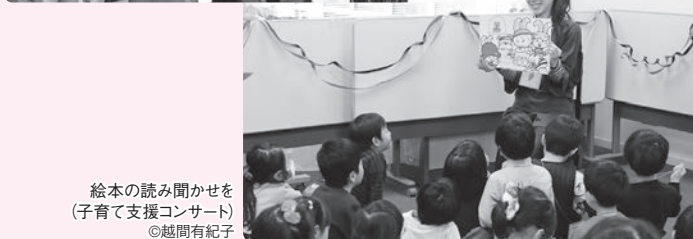
絵本の読み聞かせを(子育て支援コンサート)