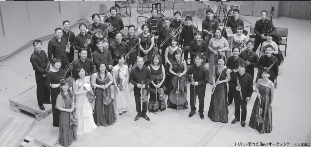
トリトン晴れた海のオーケストラ ©大塚道治