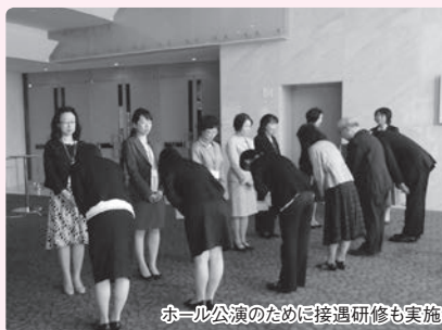
ホール公演のために接遇研修も実施