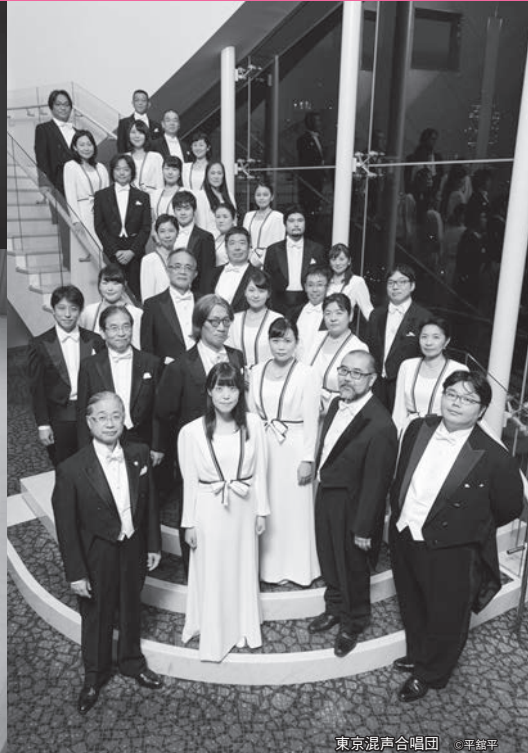
東京混声合唱団