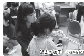
過去の様子

■13:15~14:00 [小学3年生以上] [要整理券] 7月4日(木) 12:00からWEBサイト (下記QRコード)にて 先着順に受付