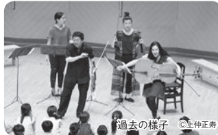
過去の様子