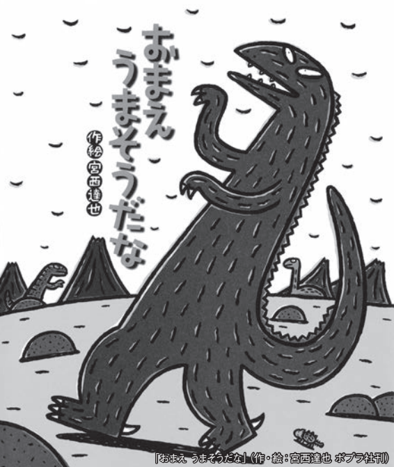
【おまえ うまそうだな】(作・絵:宮西達也 ポプラ社刊)