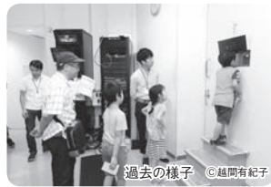
過去の様子