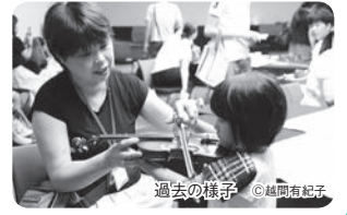
過去の様子

ヴァイオリン、ヴィオラ、 チェロ、コントラバス、 好きな楽器を選んで、音 をならしてみよう!