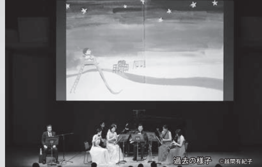
過去の様子