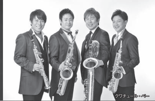
クワチュール・ペー