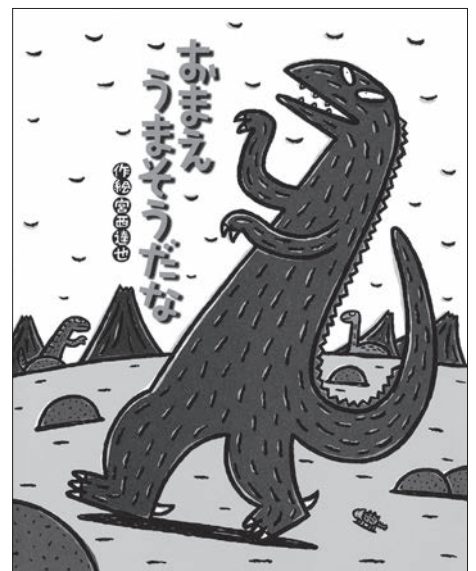
「おまえ うまそうだな」(作・絵: 宮西達也 ポプラ社刊)

トリトンアーツ通信はここに置いてあります。 配布にご協力いただける方、書いていただけるお店を大募集!