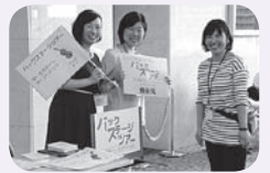
オープンハウス・サポーター

第一生命ホール夏の風物詩「オープンハウ ス」は、ホールを1日開放して、入場無料で大人 も子どもも楽しめる、年に一度のお祭りです。た くさんの笑顔が生まれるオープンハウスの当日 に、お手伝いをしていただけるサポーター(ボラ ンティアスタッフ)を募集しています。