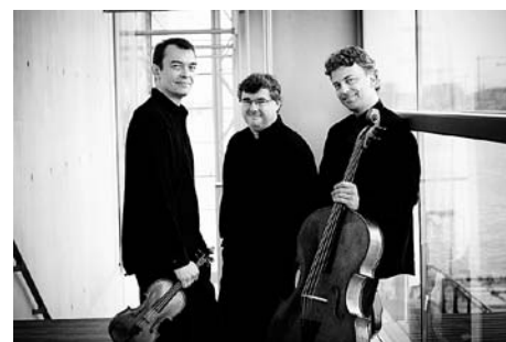
トリオ・ヴァンダラー