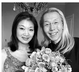
2016年新年、パリの児玉邸にて

「音楽の話は圧倒的に多いですが、ほかにも今読んでいる本のこと、おもしろい出来事、娘の学校の噂話など食事時の話題は毎日いろいろ。最近はアメリカ大統領選挙の話題が多いですね。家族全員がそろった時は、朝早くブローニュの森へ自転車に乗りに行きます。お天気が悪い時には、映画を見に行くことが多いです」